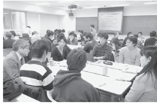
写真2 グループ討議の様子

複数の年度にわたり多くの講師に講義を担当していただいたが、講義スキルが向上するのみでなく、現役の学生と直接接することにより、学生の将来に対する期待や不安が理解でき、大学や企業の課題もみえ、さらに自